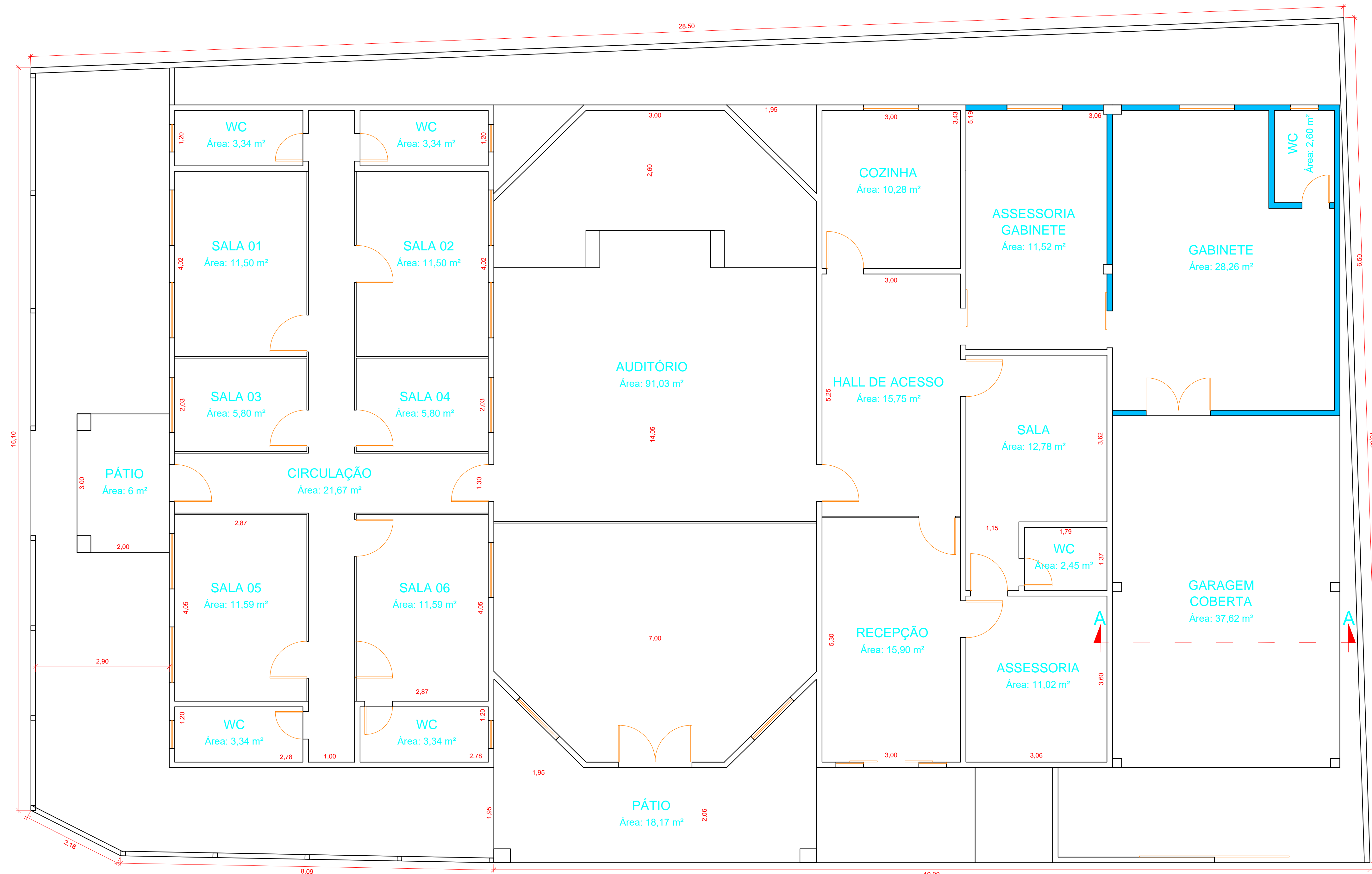
PLANTA BAIXA Escala: 1:50